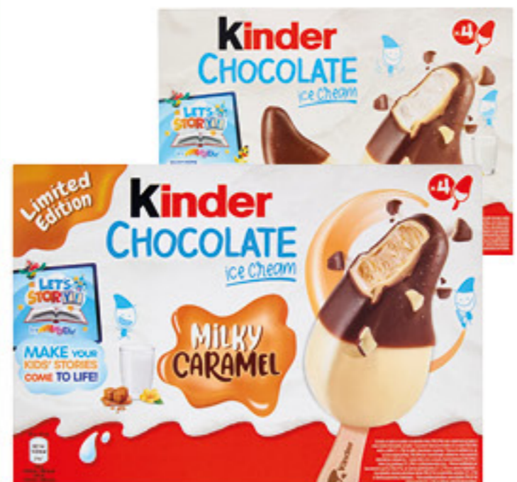
KINDER ICE CREAM MILKY CARAMEL/CHOCOLATE 220 GR 2,99 13,59 al Kg