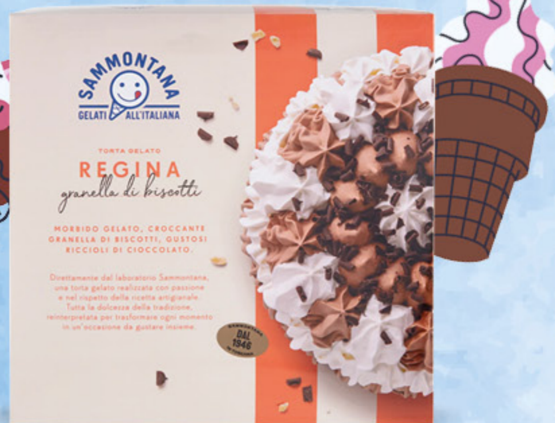
SAMMONTANA TORTA REGINA 1 KG