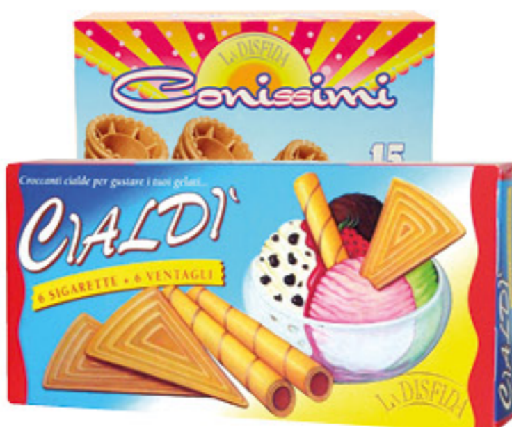
LA DISFIDA CIALDI/CONISSIMI/ GESTELLI 12/15/14 PZ