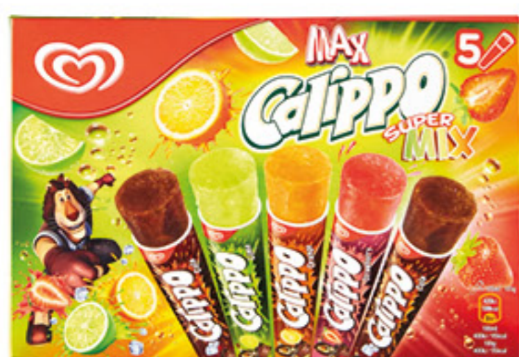
CALIPPO SUPER MIX 525 GR