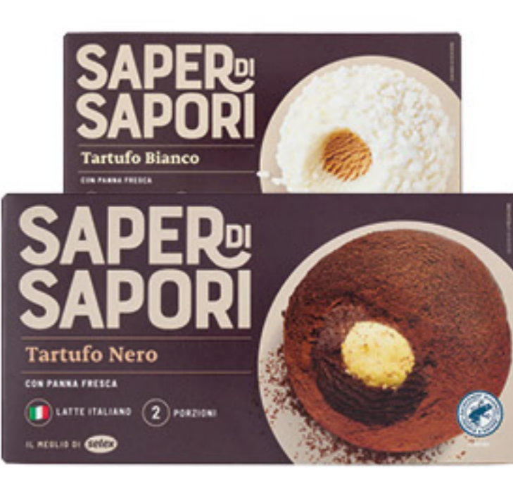
SAPER DI SAPORI TARTUFO BIANCO/NERO X 2 - 180 GR 0,99 5,50 al Kg