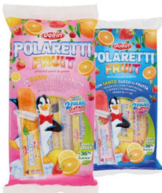
DOLFIN POLARETTI FRUIT BIMBA/BIMBO 420 ML