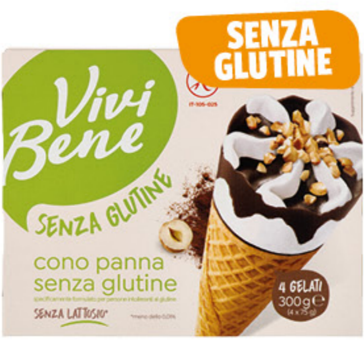
VIVI BENE SELEX 4 CONI PANNA SENZA GLUTINE 300 GR 2,79 9,30 al Kg