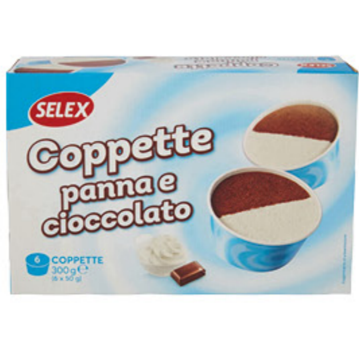
SELEX 6 COPPETTE PANNA E CIOCCOLATO 300 GR 1,99 6,63 al Kg