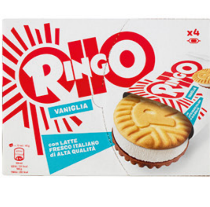
RINGO BISCOTTO GELATO VANIGLIA 160 GR 2,59 16,19 al Kg