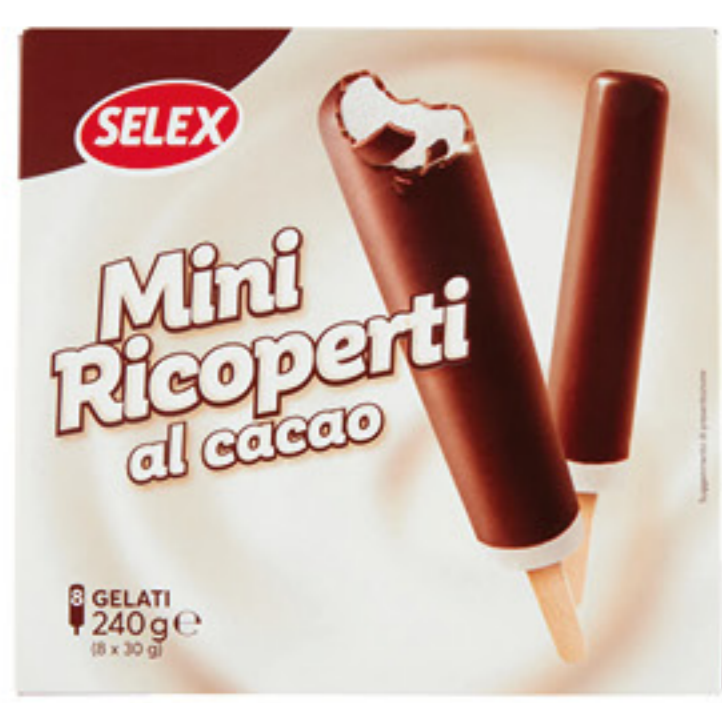
SELEX MINI RICOPERTI AL CACAO X 8 - 240 GR 1,49 6,21 al Kg