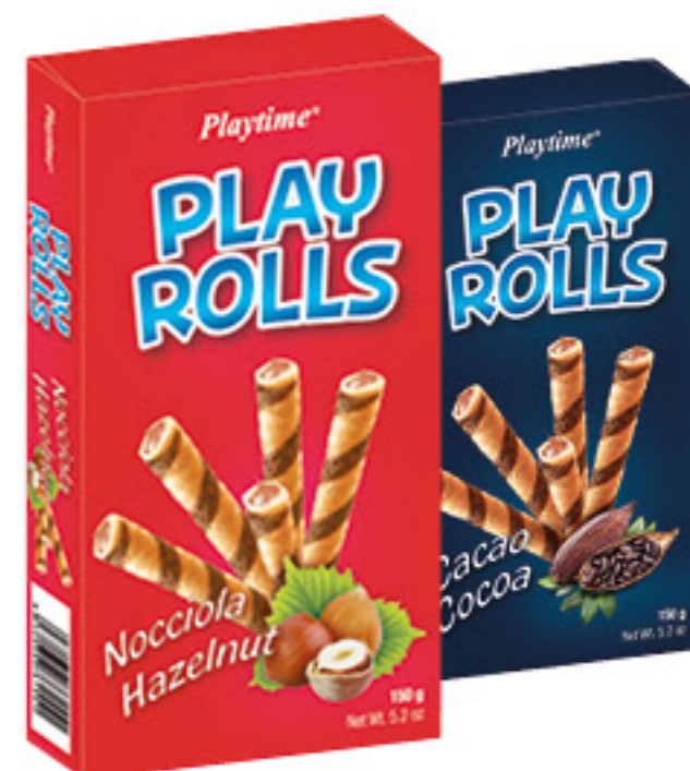
PLAYTIME PLAY ROLLS NOCCIOLA/ CACAO/CARAMELLO SALATO 150 GR