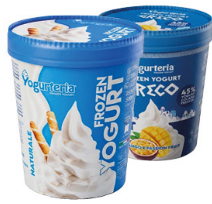
ALPEKER FROZEN YOGURT VARI GUSTI 250 GR 2,39 9,56 al Kg