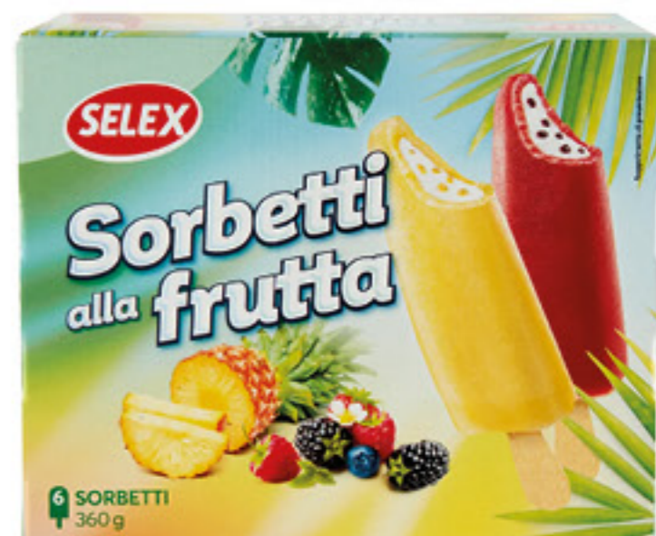
SELEX SORBETTI ALLA FRUTTA X 6 - 360 GR