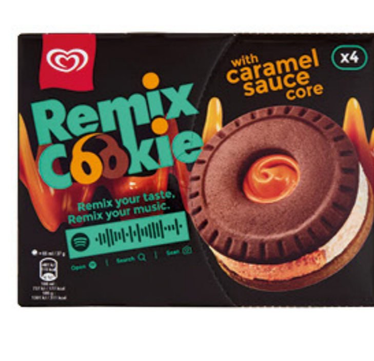
ALGIDA REMIX COOKIE X 4 - 140 GR 2,59 18,50 al Kg