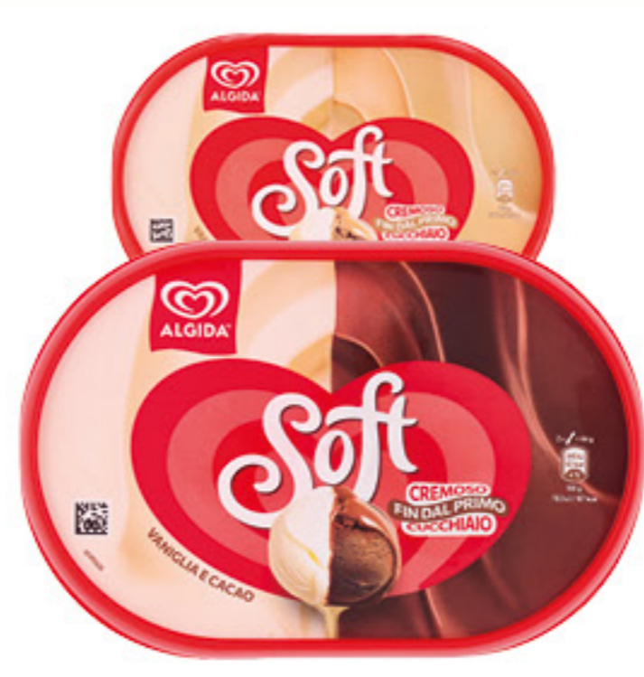
ALGIDA GELATO SOFT VANIGLIA E CACAO/CARAMELLO 440 GR