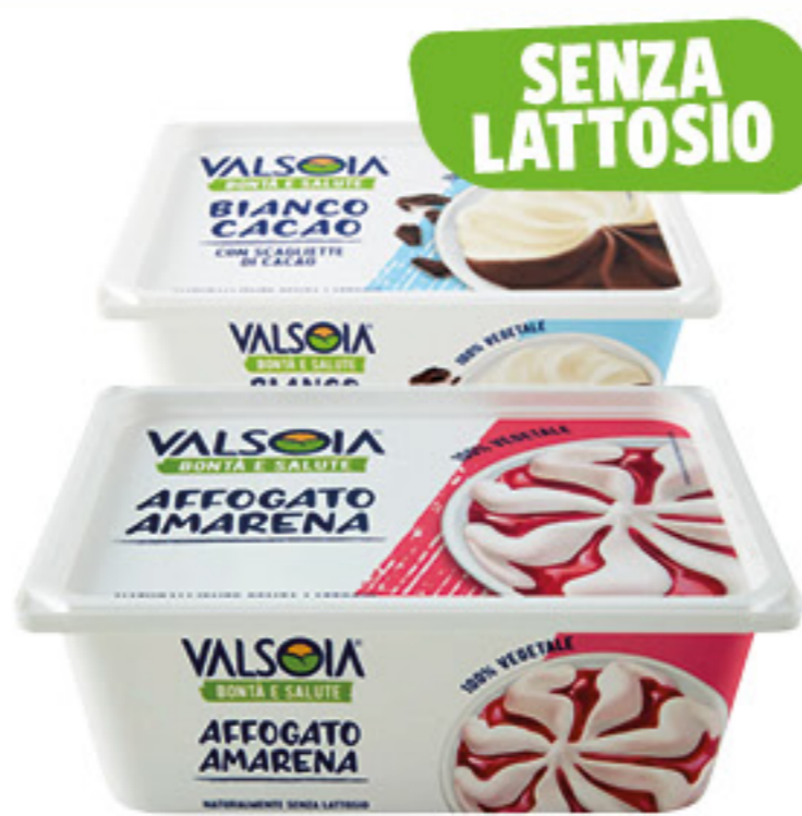
VALSOIA GELATO 100% VEGETALE VARI TIPI 400/500 GR