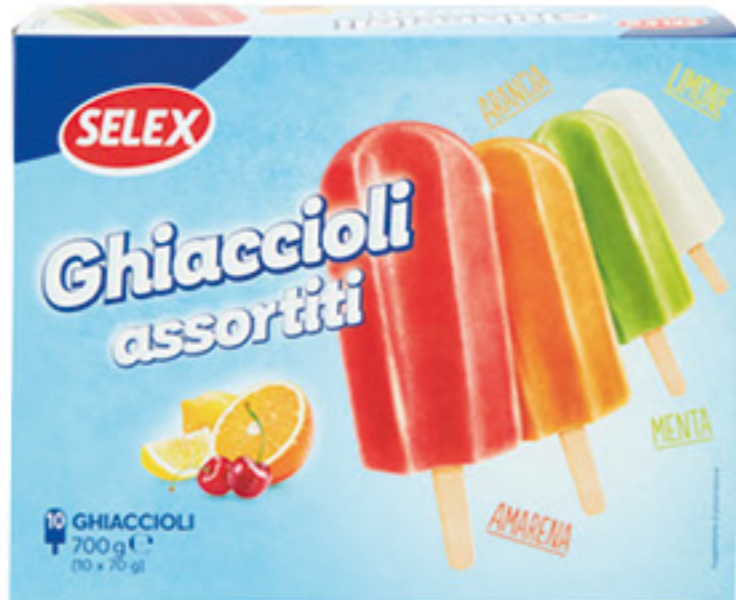
SELEX 10 GHIACCIOLI ASSORTITI 700 GR