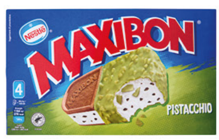
MAXIBON PISTACCHIO X 4 370 GR 2,69 7,27 al Kg