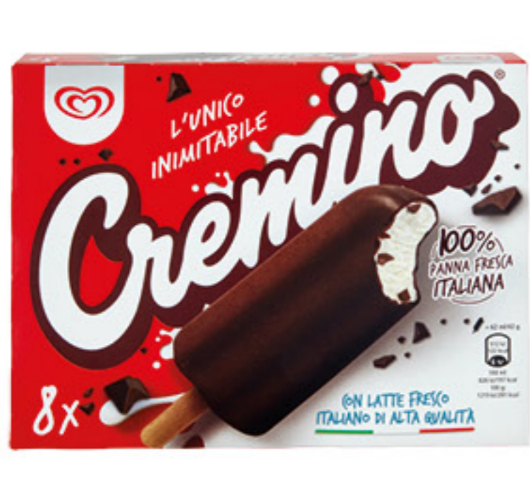
ALGIDA CREMINO X 8 - 336 GR 3,09 9,20 al Kg