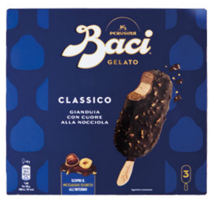
PERUGINA BACI STECCO CLASSICO X 3 - 156 GR 2,99 19,17 al Kg