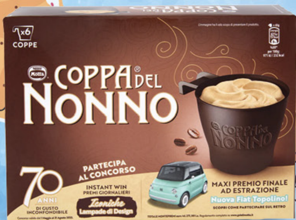
COPPA DEL NONNO 390 GR