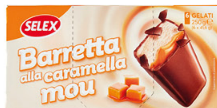
SELEX BARRETTA ALLA CARAMELLA MOU 250 GR