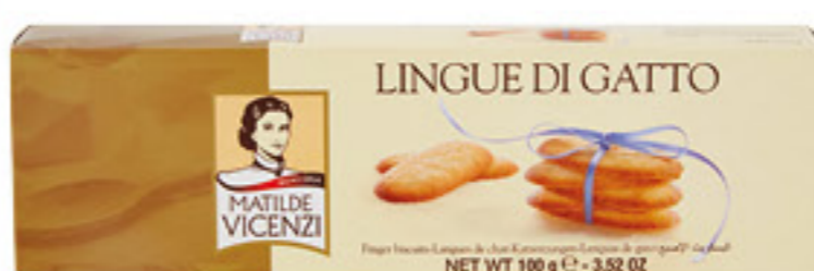
VICENZI LINGUE DI GATTO 100 GR