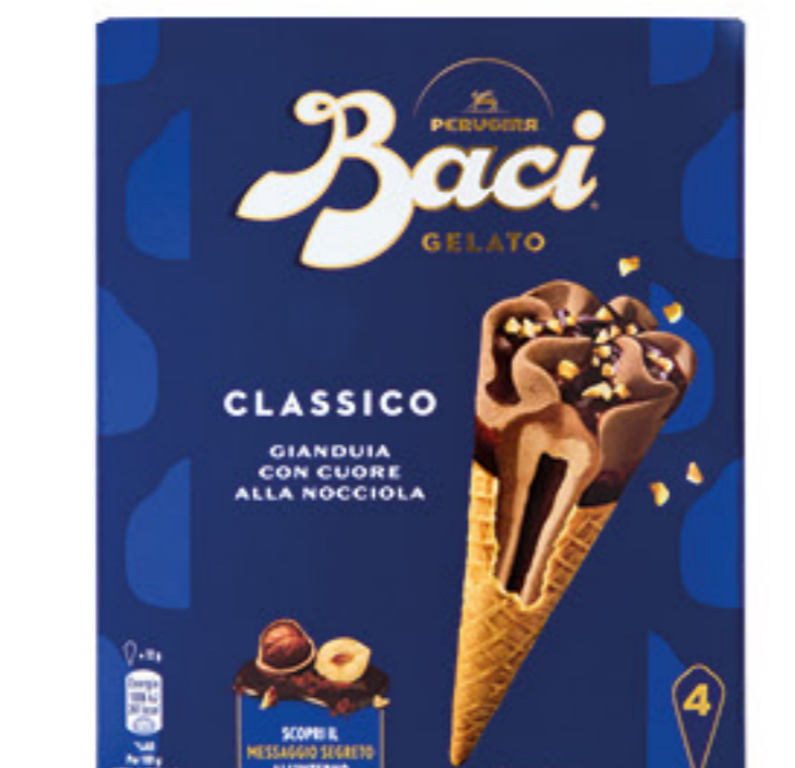
PERUGINA BACI CLASSICO 4 CONI - 288 GR 2,99 10,38 al Kg