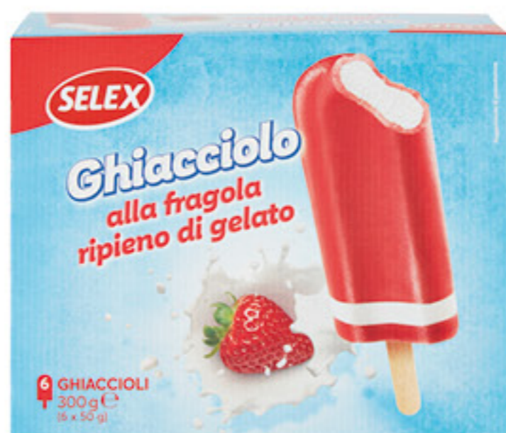
SELEX GHIACCIOLO ALLA FRAGOLA RIPIENO X 6 - 300 GR