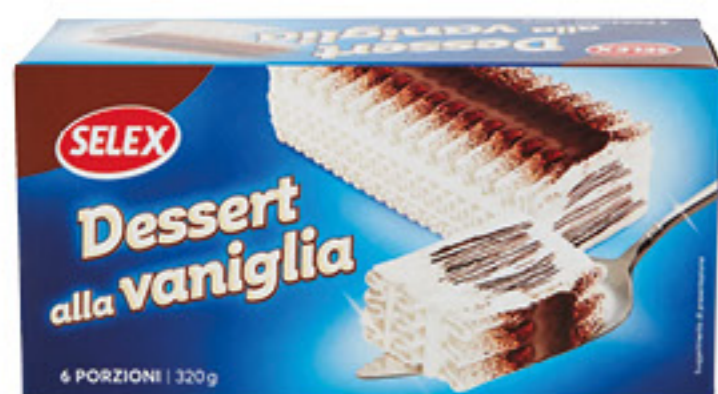
SELEX DESSERT ALLA VANIGLIA 320 GR