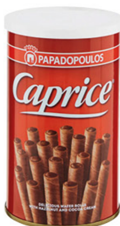
PAPADOPOULOS CAPRICE CIOCCOLATO 115 GR