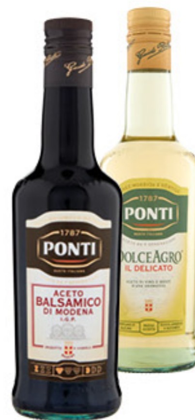
PONTI ACETO BALSAMICO IGP/ DOLCEAGRO 500 ML