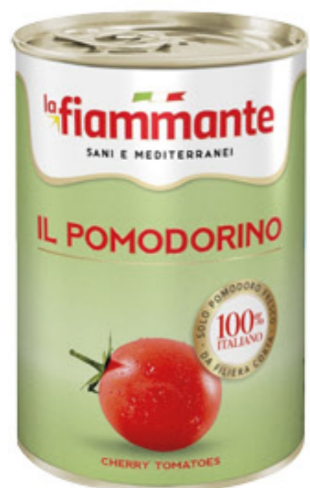
LA FIAMMANTE IL POMODORINO 400 GR