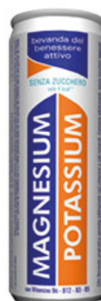
BEVANDA MAGNESIUM & POTASSIUM/ MAGNESIUM & VITAMINS 25 CL