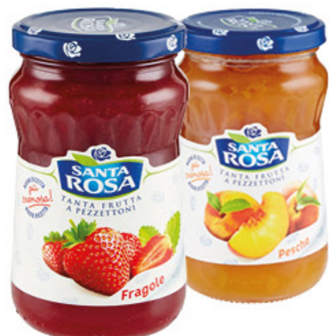
SANTA ROSA CONFETTURA VARI GUSTI 350 GR