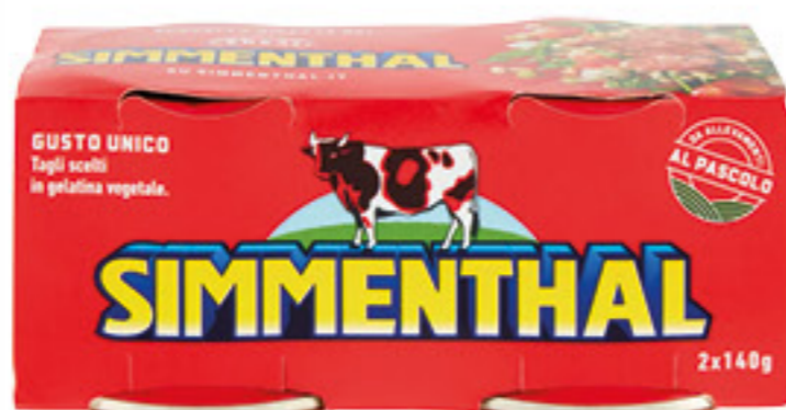
SIMMENTHAL CARNE IN GELATINA 140 GR X 2