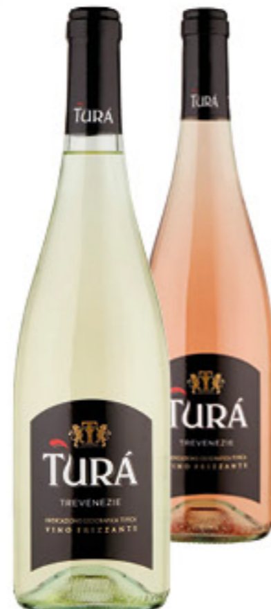
TURÀ VINO FRIZZANTE I.G.T. BIANCO/ ROSATO 75 CL