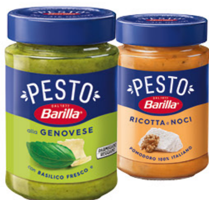
BARILLA PESTO VARI GUSTI 190/195/200 GR