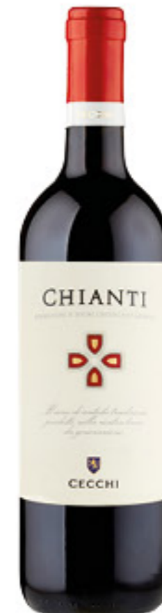
CECCHI VINO CHIANTI D.O.C.G. 75 CL