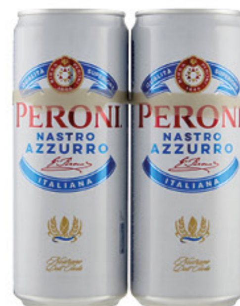
PERONI NASTRO AZZURRO BIRRA 33 CL X 2