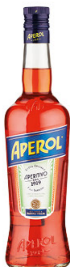
APEROL APERITIVO CLASSICO 70 CL