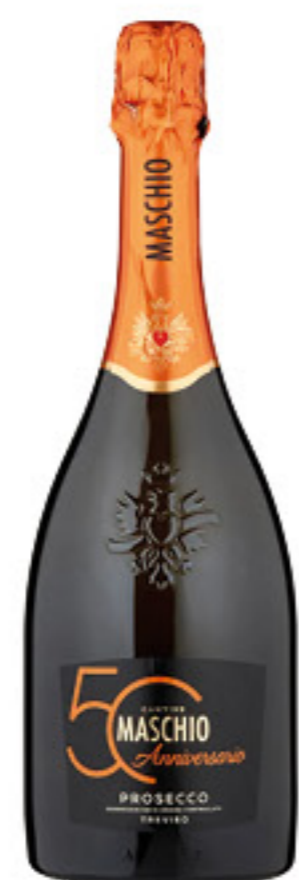
MASCHIO PROSECCO D.O.C. 75 CL