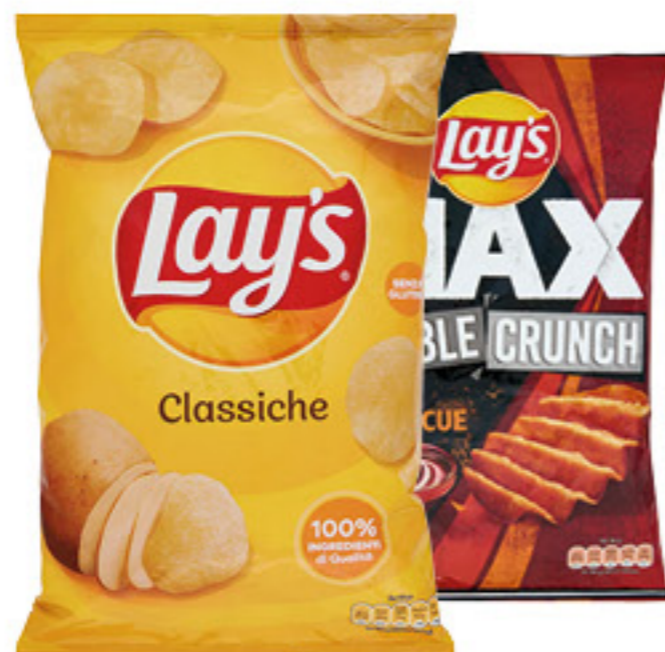
LAY'S PATATINE CLASSICHE/ DOUBLE CRUNCH/ FORMAGGIO/GRIGLIATA 110/115/145 GR