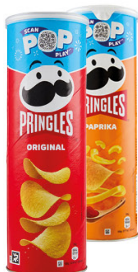
PRINGLES PATATINE VARI TIPI 175 GR