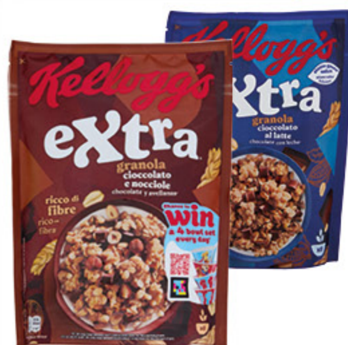
KELLOGG'S EXTRA CEREALI VARI TIPI 350/375 GR