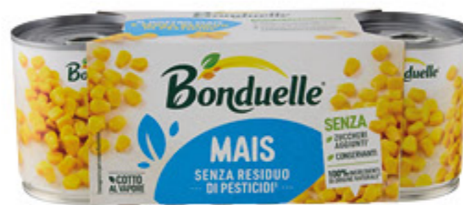
BONDUELLE MAIS COTTO AL VAPORE 150 GR X 3