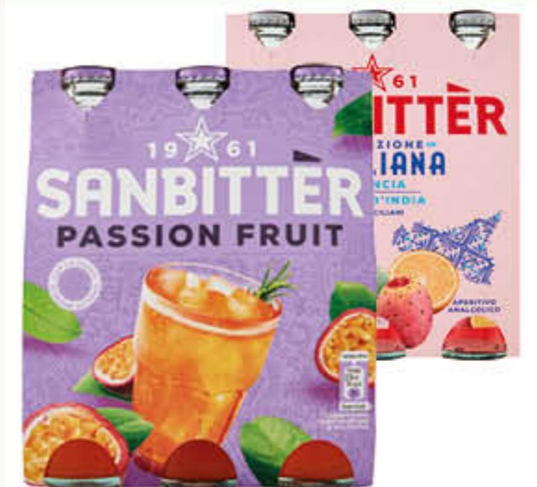
SANBITTER APERITIVO PASSIONFRUIT/ISPIRAZIONE SICILIANA 20 CL X 3