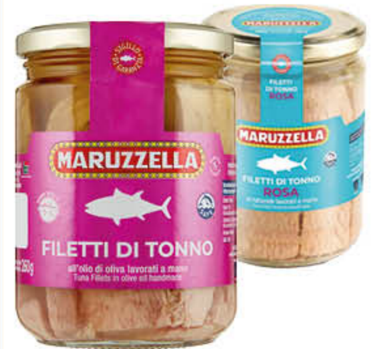
MARUZZELLA TONNO FILO D'OLIO/AL NATURALE 400 GR