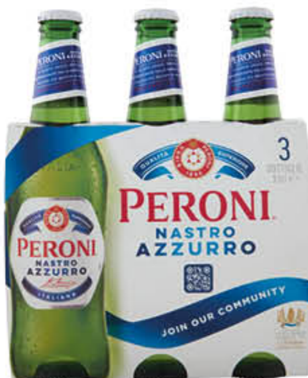
PERONI NASTRO AZZURRO BIRRA 33 CL X 3