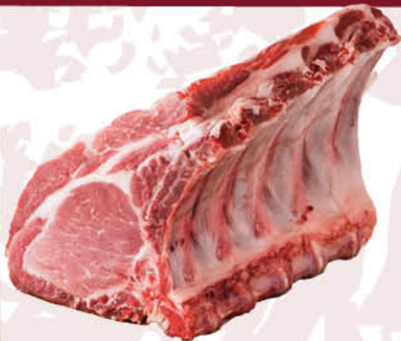
BISTECHE DI CAPOCOLLO CON OSSO E COTENNA AL KG