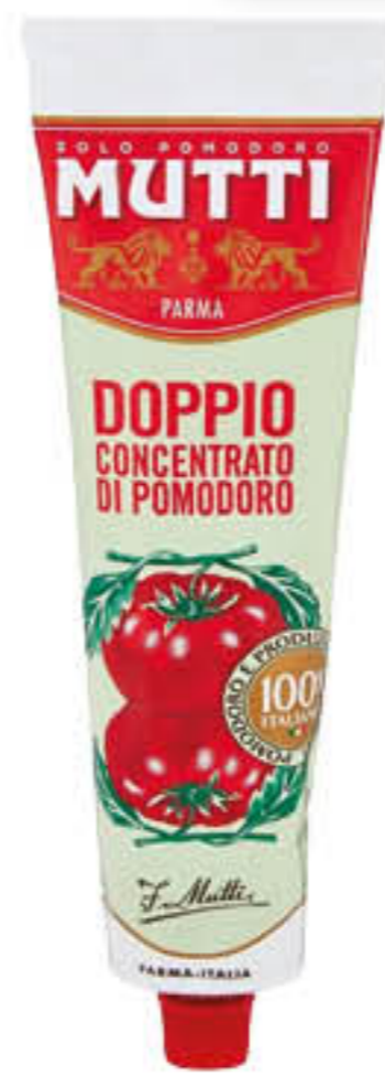
MUTTI DOPPIO CONCENTRATO DI POMODORO 130 GR