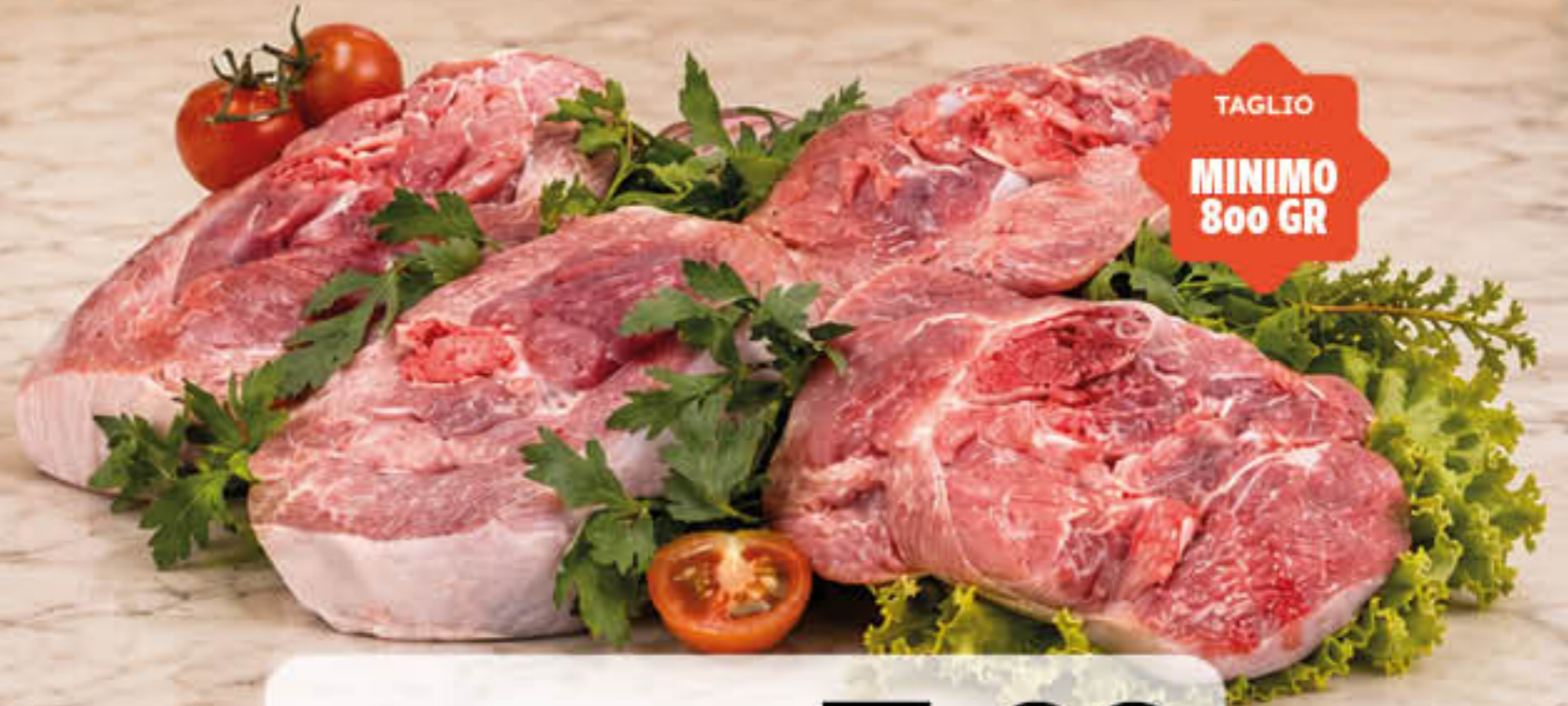
OSSOBUCO DI TACCHINO AL KG