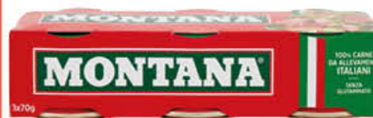
MONTANA CARNE IN GELATINA CLASSICA 70 GR X 3