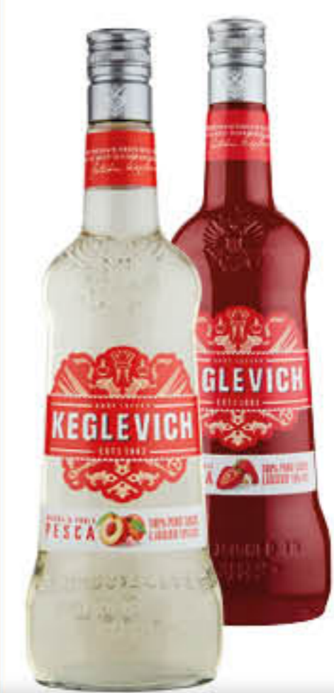
KEGLEVICH VODKA MELONE/PESCA/FRAGOLA 70 CL