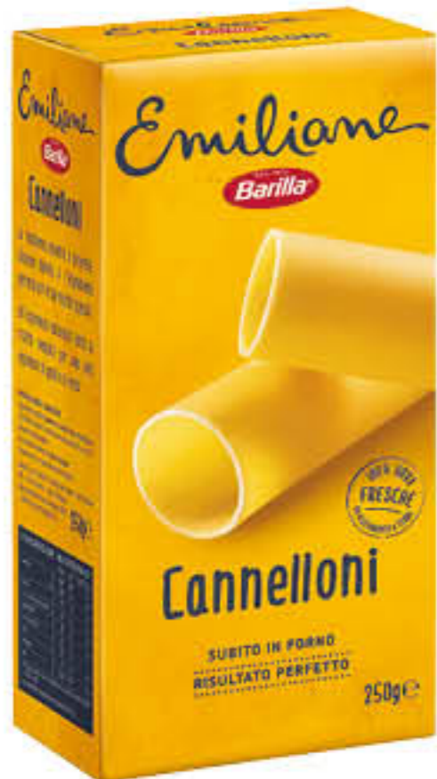
BARILLA EMILIANE CANNELLONI 250 GR