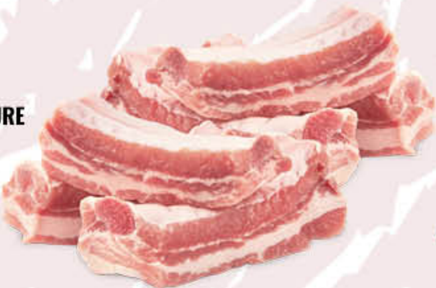
SPUNTATURE CON OSSO E COTENNA AL KG