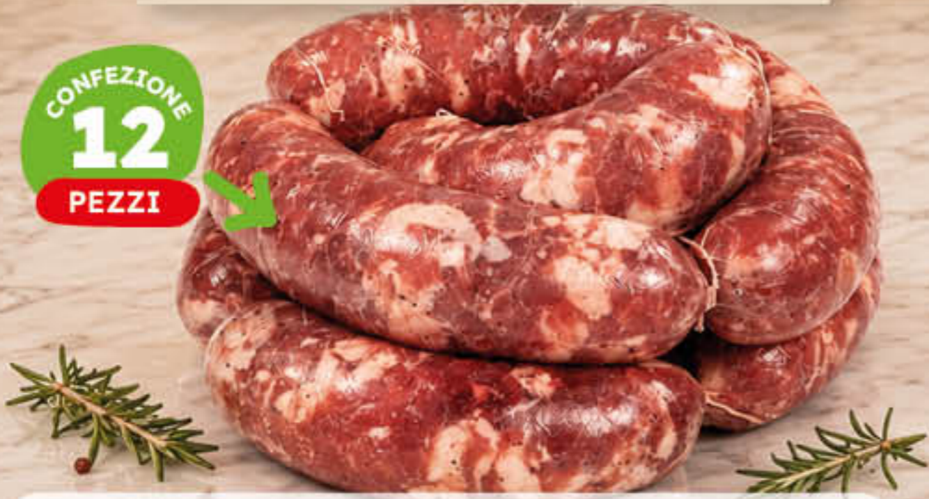
SALSICCIA SALE E PEPE A PUNTA DI COLTELLO AL KG