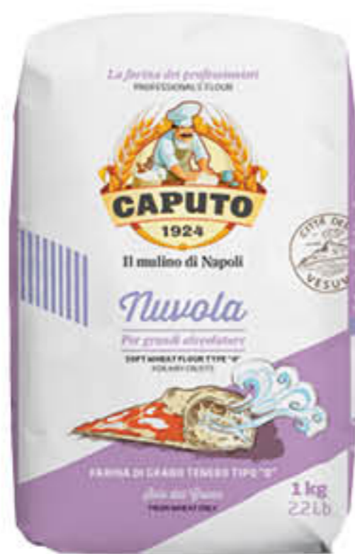
CAPUTO FARINA TIPO "0" NUVOLO 1 KG