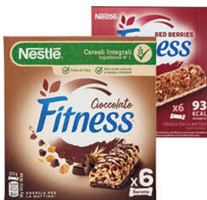
NESTLÉ BARRETTE FITNESS CIOCCOLATO/FRUTTI ROSSI 141 GR