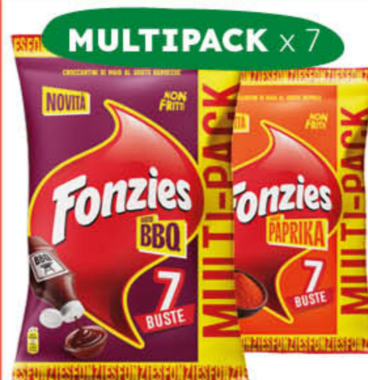
FONZIES MULTIPACK BBQ/PAPRIKA 23 GR X 7