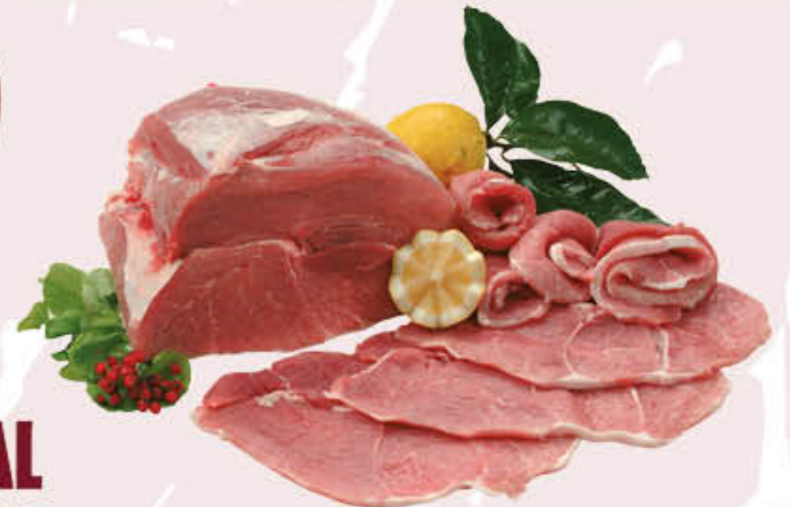
FETTINE DI PROSCIUTTO CON COTENNA AL KG