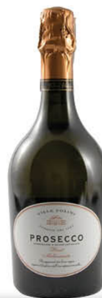
VILLA FOLINI PROSECCO D.O.C. 75 CL