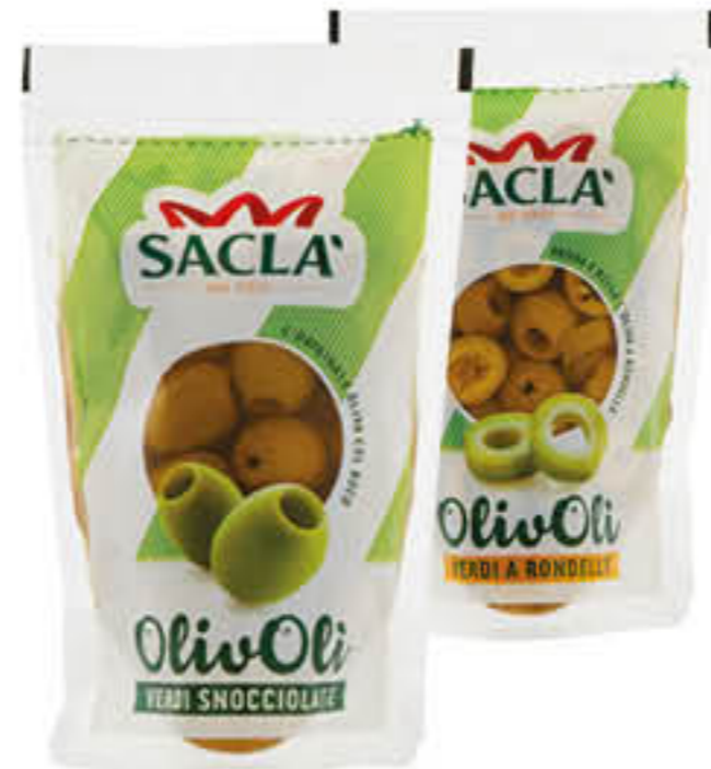
SACLÀ OLIVOLI OLIVE VERDI SNOCCIOLATE/RONDELLE 185 GR