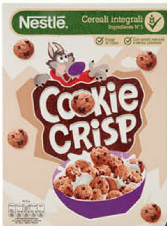
NESTLÉ CEREALI COOKIE CRISP 260 GR