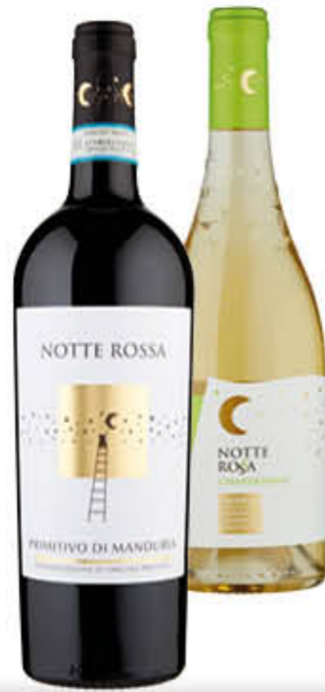
NOTTE ROSSA VINO PRIMITIVO D.O.P./CHARDONNAY I.G.P./NEGROAMARO I.G.P. 75 CL