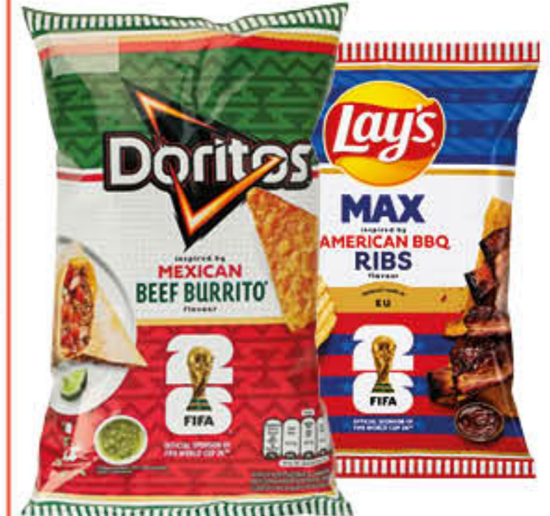
DORITOS/LAY'S MEXICAN BEEF/MAX AMERICAN BBQ 90/115 GR