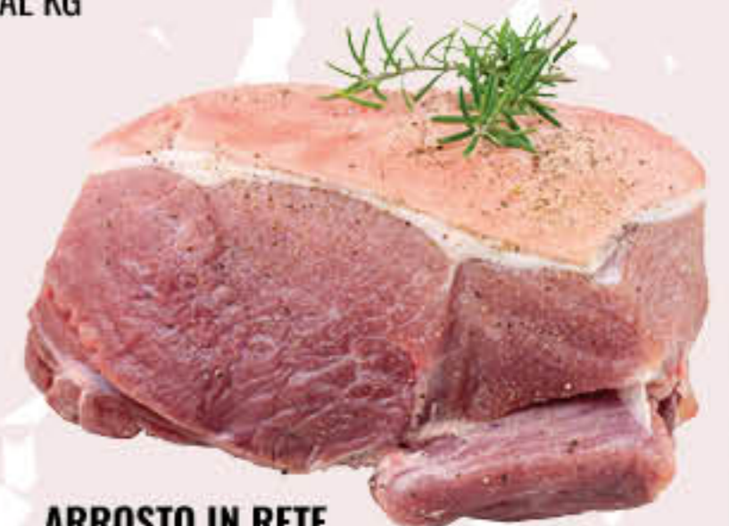
ARROSTO IN RETE CON COTENNA AL KG