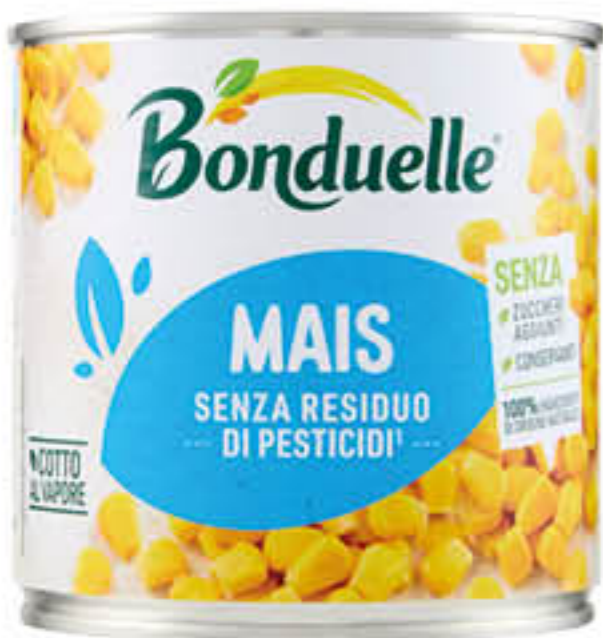
BONDUELLE MAIS COTTO AL VAPORE 300 GR