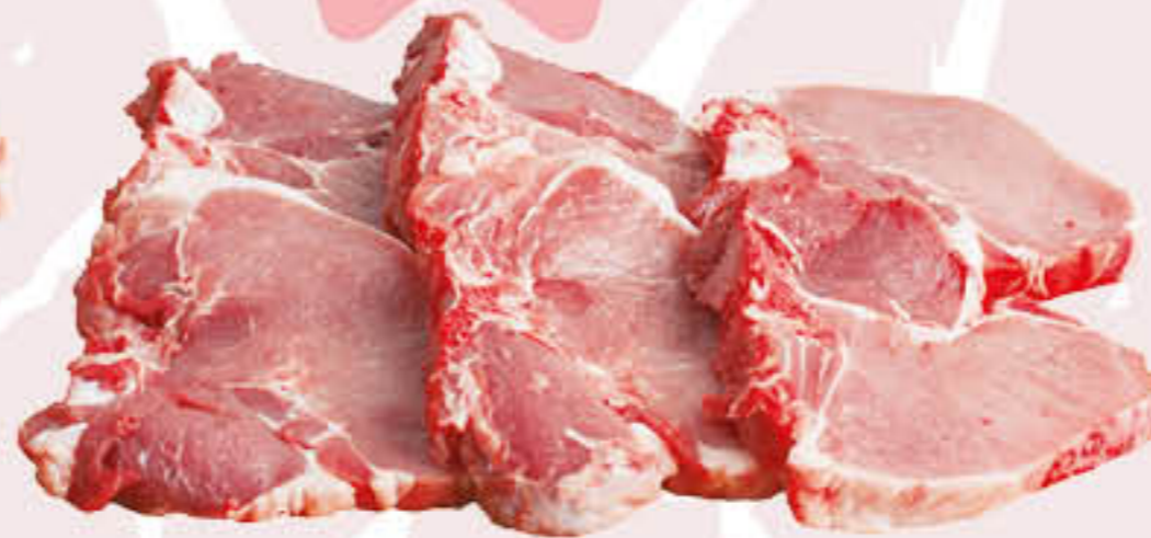
BISTECHE DI LOMBO CON OSSO E COTENNA AL KG